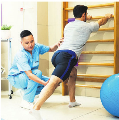
Fisioterapia y Kinesiología nueva carrera con Resolución Ministerial

Conoce las ventajas académicas de la Universidad Privada Domingo Savio y los reconocimientos que destacan su excelencia académica