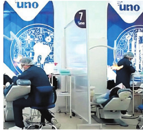
Para la UNO, la mejor manera de aprender es haciendo y practicando

Pronto se inaugurará el edificio de cinco plantas, con 30 aulas equipadas tecnológicamente para clases teóricas, una sala de docentes con equipos tecnológicos, 20 laboratorios, un auditorio multipropósito especial para seminarios, talleres, congresos, con capacidad para 250 personas, y oficinas administrativas; en la parte superior anfiteatros acordes a los tiempos modernos para la investigación de estudiantes y docentes, y un área de preparación de cádáveres, museo morfológico, entre otros.