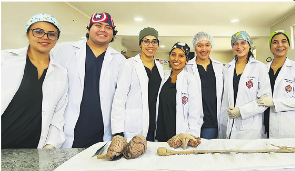
La UEB en un ambiente académico, cristiano y disciplinado tiene la misión de formar profesionales competitivos, íntegros, idóneos y serviciales