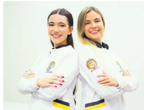
Profesionales. Listos para las demandas del mundo actual

Las instalaciones están equipadas con dos aulas, dos clínicas