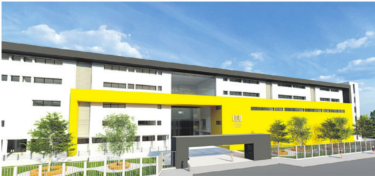
Nuevo. El edificio de la Universidad Católica Boliviana está ubicado en el Campus Universitario del Km 9, carretera al Norte. Cuenta con 13.000 m2 distribuidos en cinco niveles