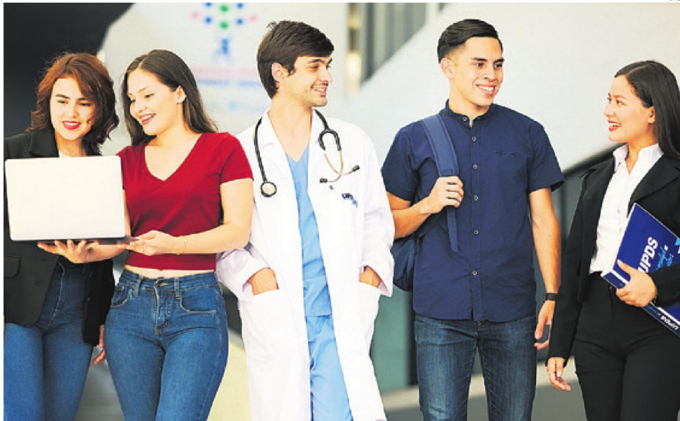
El inicio de clases es el 5 de febrero para la Facultad Ciencias de la Salud, 7 de febrero presencial modular y 10 de febrero semipresencial