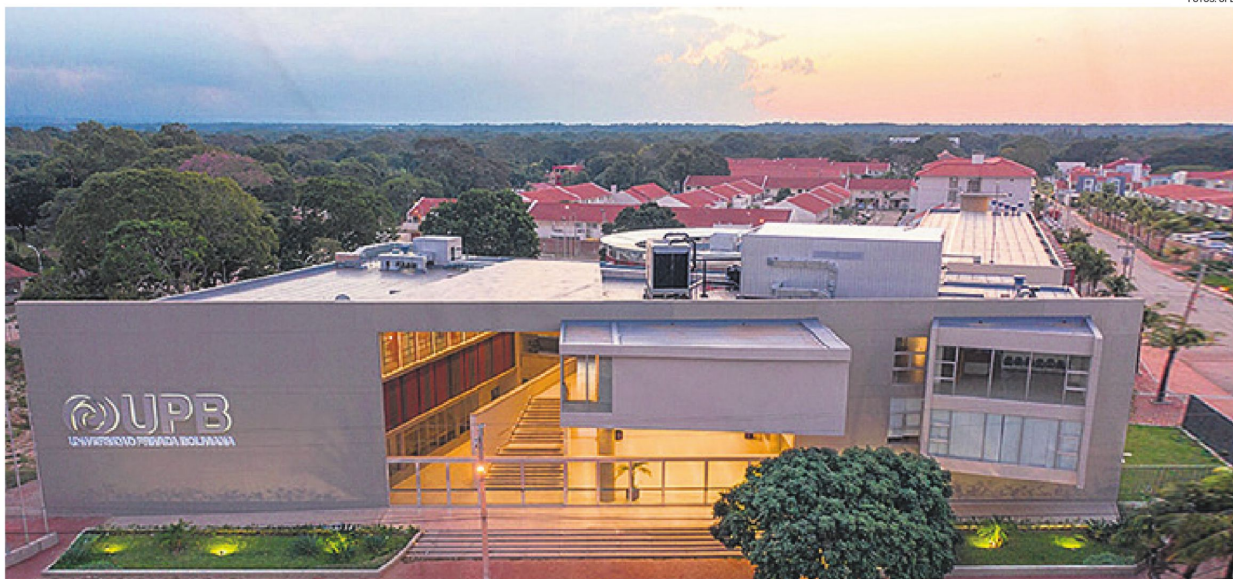
Infraestructura. La Universidad Privada Boliviana (UPB) posee un amplio y moderno campus para la formación de los estudiantes de pregrado y postgrado