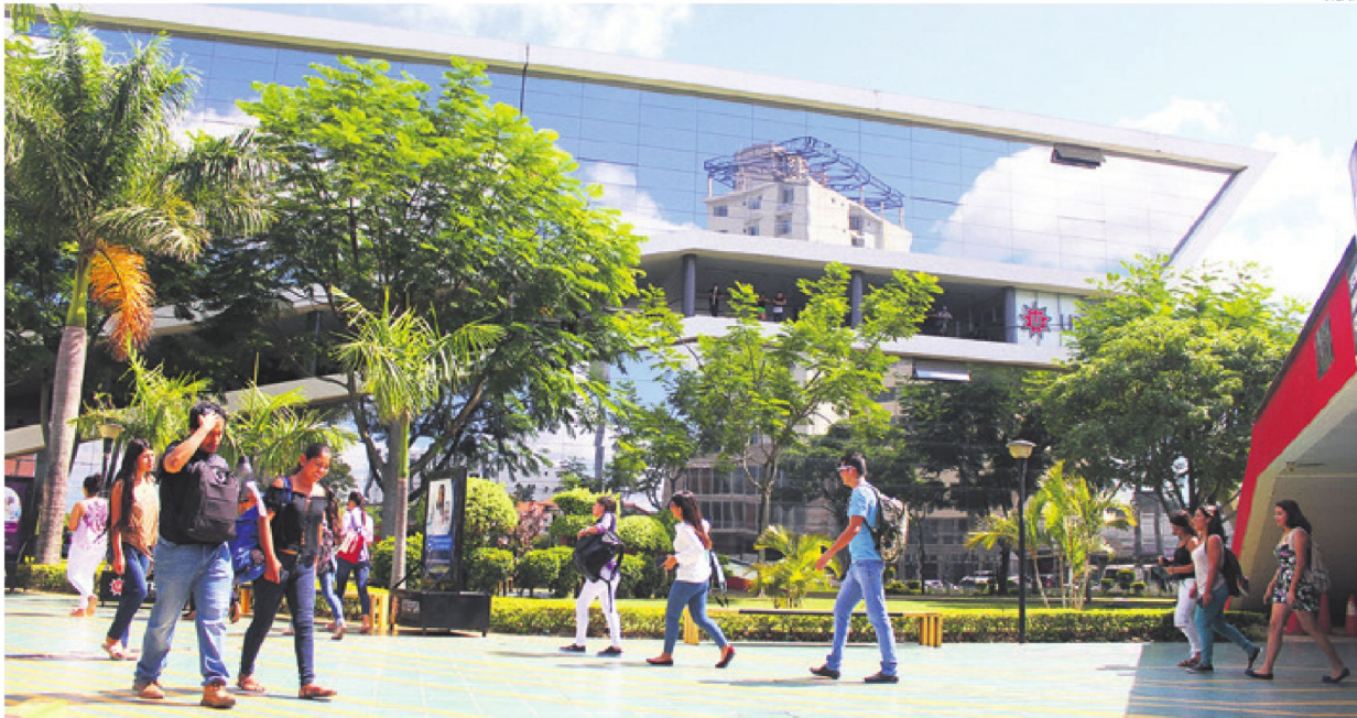
El campus universitario está diseñado y construido para el desarrollo académico, cuenta con modernos laboratorios equipados y actualizados para las prácticas