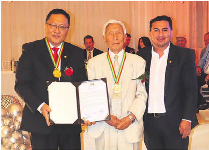
Autoridades de la Ucebol distinguidos por la Asamblea Legislativa Plurinacional-Cámara de Diputados