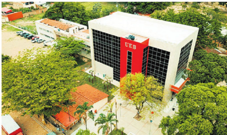
La nueva infraestructura para la Facultad de Agropecuaria y Veterinaria brinda las mejores condiciones

En el área deportiva, se enorgullece de contar con el Equipo UEB de Fútbol 11, el cual ha logrado el título Campeón 2023 del Torneo organizado por la Asociación Cruceña de Fútbol