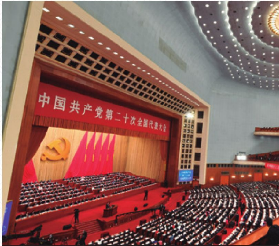
Sesión del XX Congreso Nacional del PCCh, Beijing 2022.

“Es una cristalización de la sabiduría del Partido y el pueblo, una declaración política y programa de acción de nuestro Partido para unir y conducir al pueblo de todas las etnias del país en la conquista de nuevas victorias”.