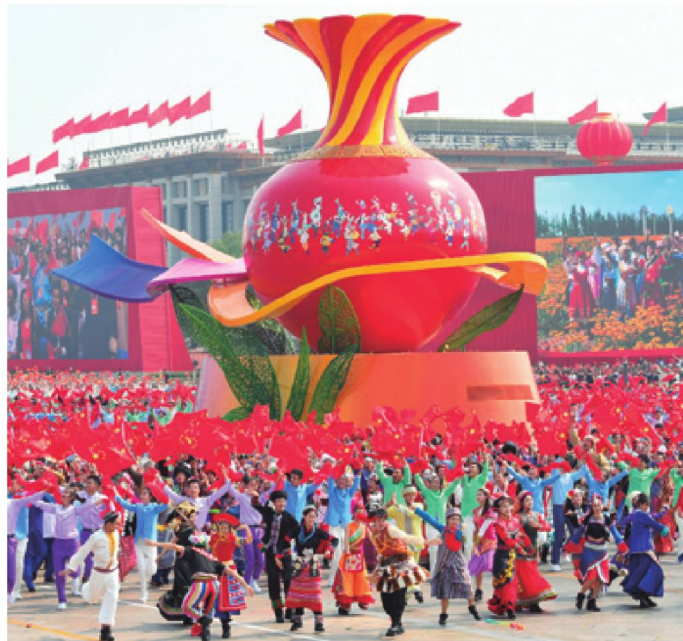
China es un país diverso y unificado.

Desde su fundación, el Partido Comunista de China ha encausado sus esfuerzos en mejorar la calidad de vida y acercar a la felicidad al pueblo chino bajo el criterio de que el desarrollo debe ser compartido y la prosperidad disfrutada por todos. En la última década, China ha dado grandes pasos, algunos a una escala colosal, para poder garantizar el bienestar, la salud, la seguridad y educación de alta calidad para el pueblo. Algunos ejemplos recientes son la eliminación de la pobreza extrema, el combate a la pandemia y el establecimiento del sistema de seguridad social más grande del mundo.