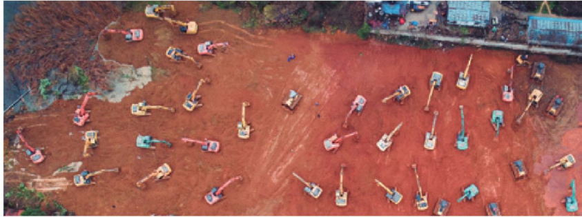
Construcción de un Hospital de Emergencia en 10 días para 1000 pacientes durante la inicio de la pandemia (2019).

En opinión del Presidente Xi, la innovación se enfoca en resolver el problema de la fuerza motriz del desarrollo, la coordinación se enfoca en resolver el problema del desarrollo desequilibrado, el desarrollo verde se enfoca en resolver el problema de la armonía entre el ser humano y la naturaleza, y la apertura se enfoca en resolver el problema de articulación entre el desarrollo interno y externo; finalmente, el desarrollo compartido se enfoca en resolver el problema de equidad y justicia social.