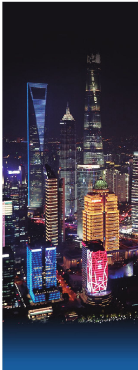
Zona de Libre Comercio en Shanghai.

Las cuatro regiones del país: este, centro, oeste y noreste se están desarrollando de forma vinculada. Entre 2013 y 2021, la tasa de crecimiento anual promedio del PIB en las regiones central y occidental llegó el 7,5% y 7,7%, respectivamente, representando un crecimiento 0,5 y 0,7 puntos más rápido que el de la región oriental, la cual tradicionalmente era la más dinámica y próspera. El desarrollo coordinado entre Beijing, Tianjin y Hebei, el desarrollo de la Franja Económica del Río Yangtze, la construcción de la Gran Área de la Bahía de Guangdong-Hong Kong-Macao, el desarrollo integrado del Delta del Río Yangtze, la protección ecológica y el desarrollo de alta calidad de la cuenca del Río Amarillo, entre otras importantes estrategias regionales, se han implementado con eficacia y están mostrando resultados sobresalientes.