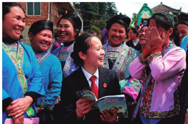
Encuentro de aldeanos con delegados.