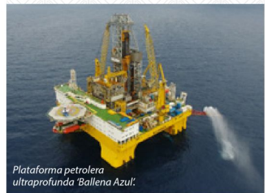
Plataforma petrolera ultraprofunda 'Ballena Azul'.