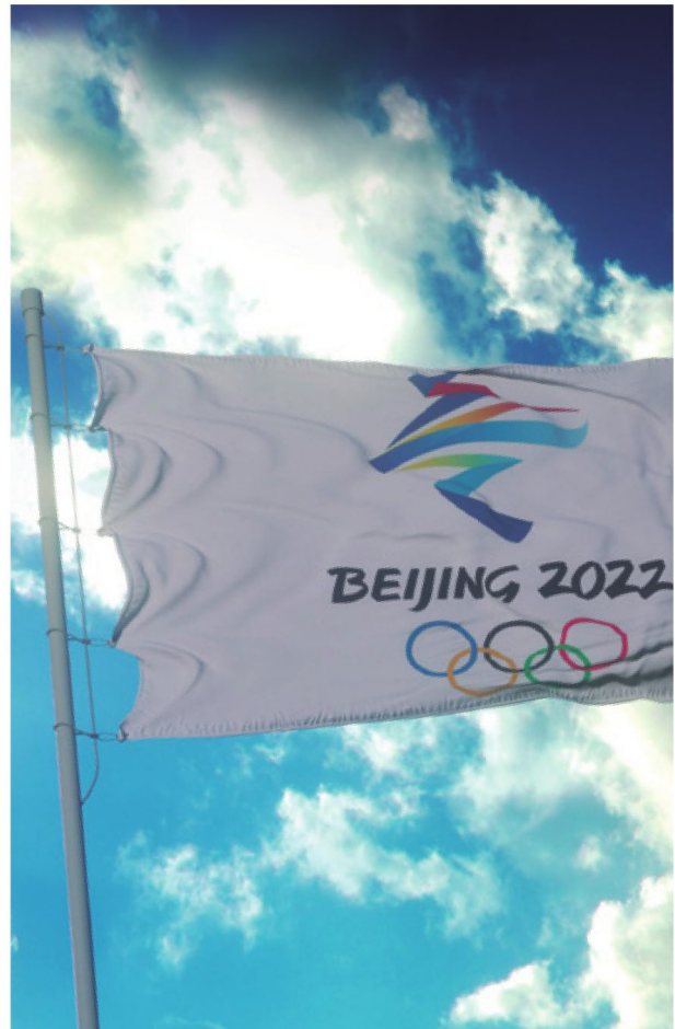
Olimpiadas de Invierno Beijing 2022.

El ex Secretario General Adjunto de las Naciones Unidas y ex Director Ejecutivo del Programa de la ONU para el Medio Ambiente (UNEP), Erik Solheim, dijo que el progreso del desarrollo ecológico de China ha sido "realmente inspirador".