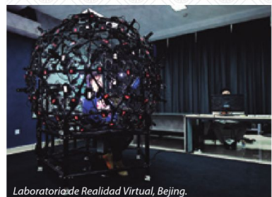
Laboratorio de Realidad Virtual, Beijing.