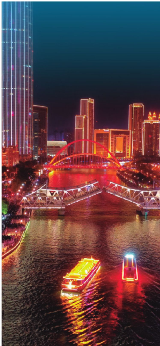
Río Haihe, Tainjin.