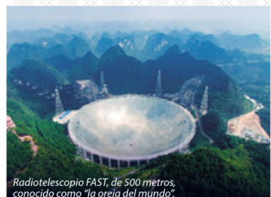
Radiotelescopio FAST, de 500 metros, conocido como "la oreja del mundo".