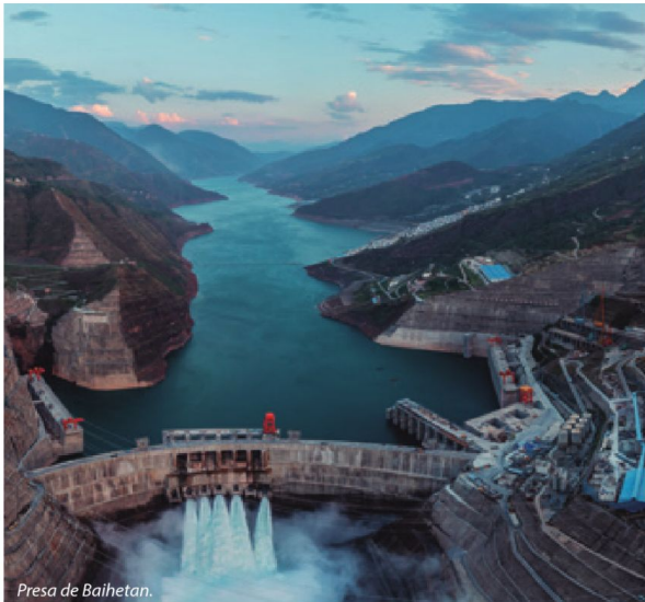
Presa de Baihetan.

La construcción de una civilización ecológica es fundamental para el desarrollo sostenible del país y del mundo. Desde hace 10 años, el Gobierno central, bajo la dirección del Presidente Xi Jinping, ha tomado medidas para impulsar el programa de civilización ecológica y apoyar el desarrollo verde de toda China. A juicio del Presidente Xi Jinping, “Las aguas cristalinas y las montañas verdes, son tan valiosas como las montañas de oro y plata”.