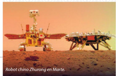
Robot chino Zhurong en Marte.