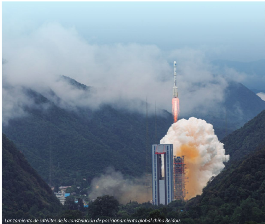
Lanzamiento de satélites de la constelación de posicionamiento global chino Beidou.