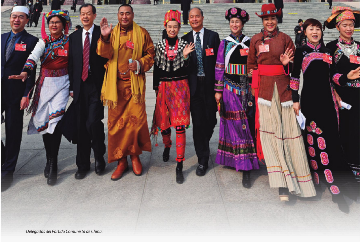
Delegados del Partido Comunista de China.

Extracto de la resolución sobre enmienda a los Estatutos del PCC del XX Congreso Nacional.