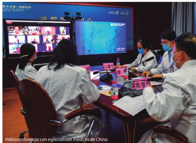
Videoconferencia con especialistas médicos de China.

Otorgando la máxima prioridad a la protección de la vida y la salud de las personas, China consiguió coordinar el desarrollo económico con el combate a la pandemia logrando, en muy corto plazo, la mejor recuperación y crecimiento económico en el mundo.