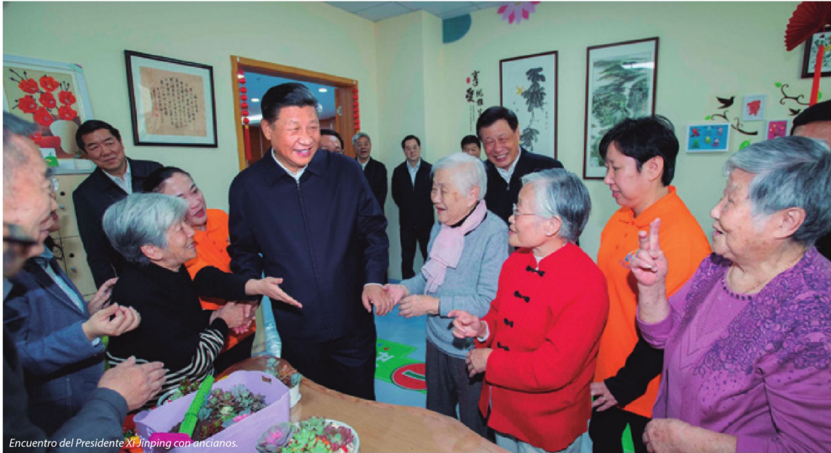
Encuentro del Presidente Xi Jinping con ancianos.