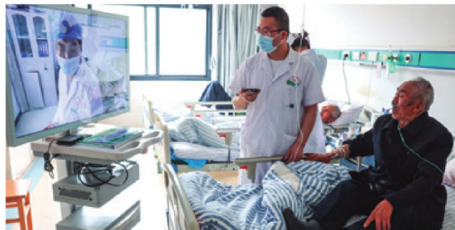
Diagnóstico por telemedicina a un paciente de la etnia Miao.

Según el Catorceavo Plan Quinquenal de Desarrollo de China y el esquema de la Visión 2035, una serie de medidas de reforma permitirán que todo el pueblo logre avanzar con pasos sólidos hacia el desarrollo personal y colectivo, hasta alcanzar una verdadera prosperidad común.