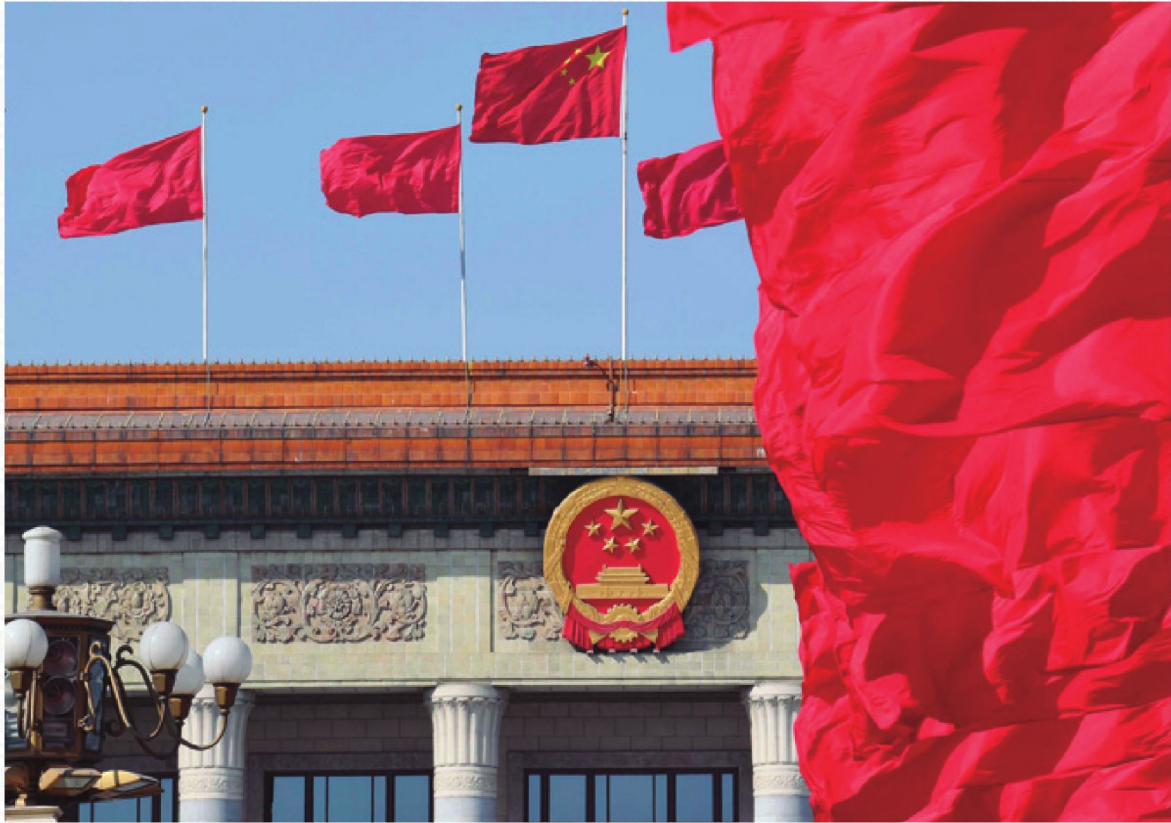
Gran Palacio del Pueblo, Beijing.

Para el PCCh, la modernización al estilo chino deber tener cinco elementos: Se trata de una modernización para una población enorme, implica alcanzar la prosperidad común para todo el pueblo, hacer avances coordinados entre lo material y lo espiritual, fomentar la armonía entre el ser humano y la naturaleza y mantener un desarrollo pacífico.