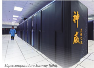
Súpercomputadora Sunway Taihu.