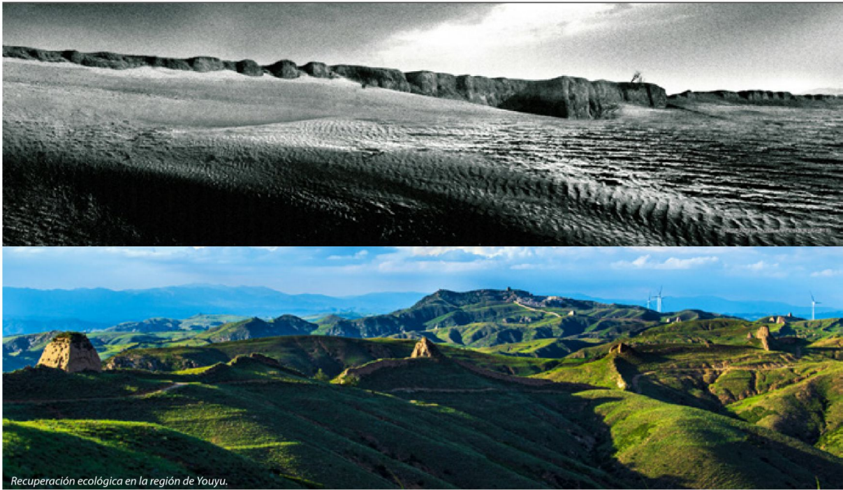
Recuperación ecológica en la región de Youyu.

CHINA - Modernizándose a su estilo XX Congreso Nacional del Partido Comunista de China