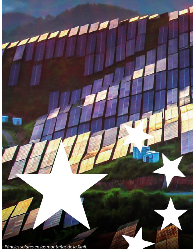
Páneos solares en las montañas de la Xinji.

La competencia entre países es, en última instancia, la competencia de la capacidad de innovación; mientras que, la ciencia y la tecnología son la fuerza motriz fundamental para el desarrollo industrial. Tal como señaló el Presidente Xi Jinping: “Quien sea que se adelante en la innovación científica y tecnológica podrá tomar la iniciativa y ganar ventaja”.